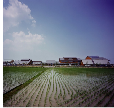
□ながしま遊館(三重県)