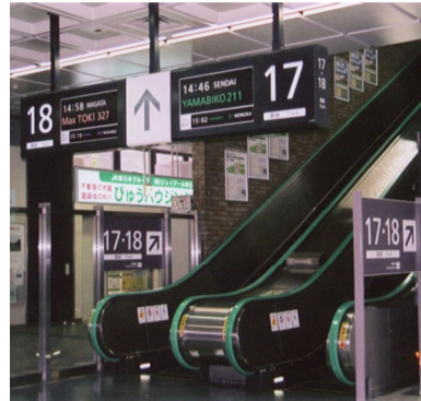
□JR東日本新しい発車時刻案内ボード(東京都・埼玉県ほか)