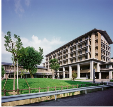
□郡上市市民病院(岐阜県)