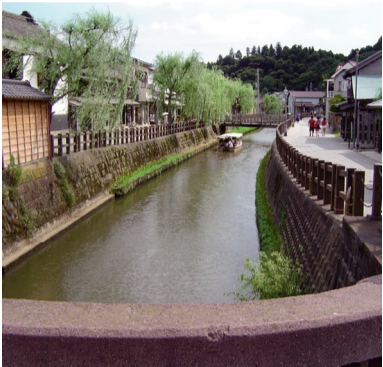
□佐原重要伝統的建造物群保存地区(千葉県)