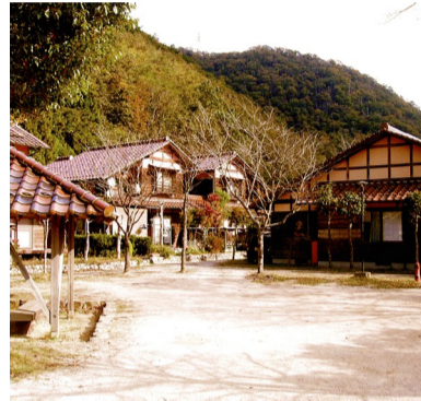
□日野辺市営住宅(兵庫県)