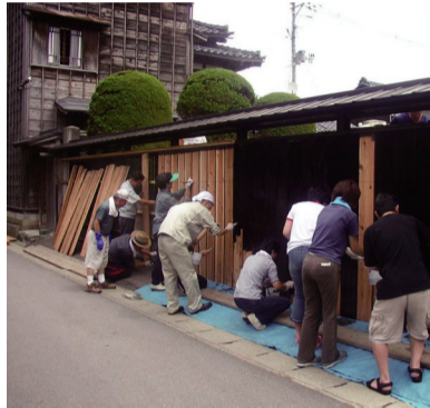
□安善小路の黒塚プロジェクト(新潟県)