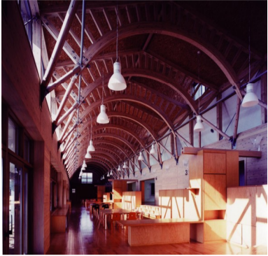
□明安小学校・田園風景を生かした木肌の温もり(山形県)