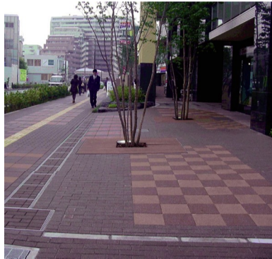
□駅前再生を契機とした美しい街並み景観形成の取り組み(花小金井駅北口地区)(東京都)