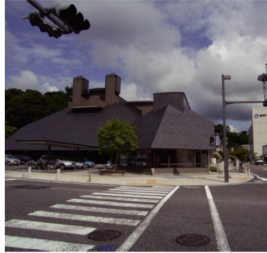
□三春町中心市街地・大町地区及び周辺の四季の色に調和する街並みの色彩(福島県)